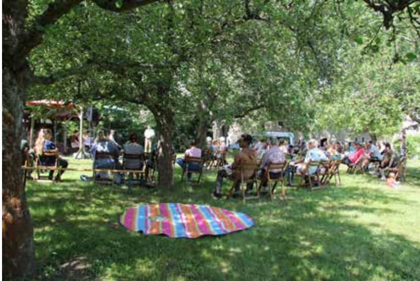
Oase-Gottesdienst in Skassa