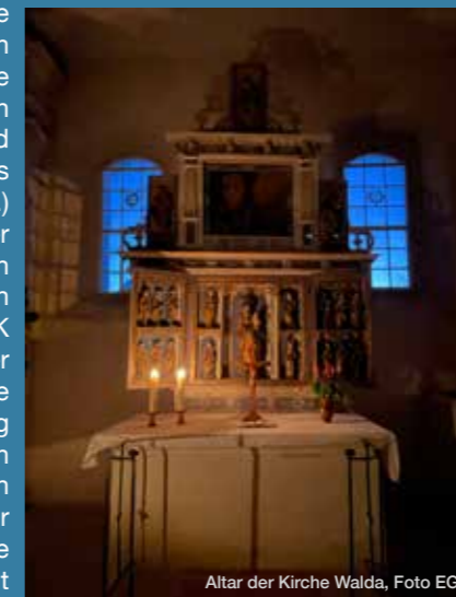
Altar der Kirche Walda

Walda? Warum Walda? Wal-da-nichts ist? Nein, der kleine Ortsteil von Großenhain kann mit vielem aufwarten. Ein als Kinderheim genutztes Schloss, einen Schlosspark, wunderbare Spaziergänge entlang der Röder und seine kleine, aber feine Kirche. Zwischen alten Bäumen eines Kirchhofes gelegen, zählt die Waldaer Kirche zu den ältesten Kirchenbauten der Region, weitaus länger als 1494 bestehend (laut einer Einschätzung im Jahr 1970 aus dem Amt für Denkmalpflege um das 10. Jhd.) Aber nicht nur historisch hat die Waldaer Kirche eine wichtige Funktion. Alle Orte in denen ehemals Begegnungen stattfanden und die mit dem Anfangsbuchstaben K anfangen, sind verschwunden. Die Kneipe, der Konsum- sie wurden abgerissen. Nur unsere kleine Kirche blieb als Ort der Begegnung erhalten. Nicht nur aus dem eigenen Erleben heraus, sondern auch schriftlich im Kirchenarchiv nachvollziehbar waren für Sanierungsmaßnahmen in und an der Kirche schon seit über 150 Jahren die Gelder recht knapp, ein auf den ersten Blick unschöner Zustand - für die mittlerweile hinzugezogenen Denkmalschützer und Restauratoren wiederum ein glücklicher Umstand. Not ist der beste Schutz für Denkmale! Nun soll mit der gemeinsamen Kraft der Kirchgemeinde Großenhainer Land eine umfangreiche Sanierung und Restaurierung der Kirche beginnen.