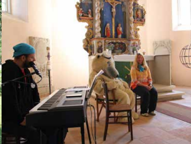
Bärenstark-Gottesdienst in Lenz